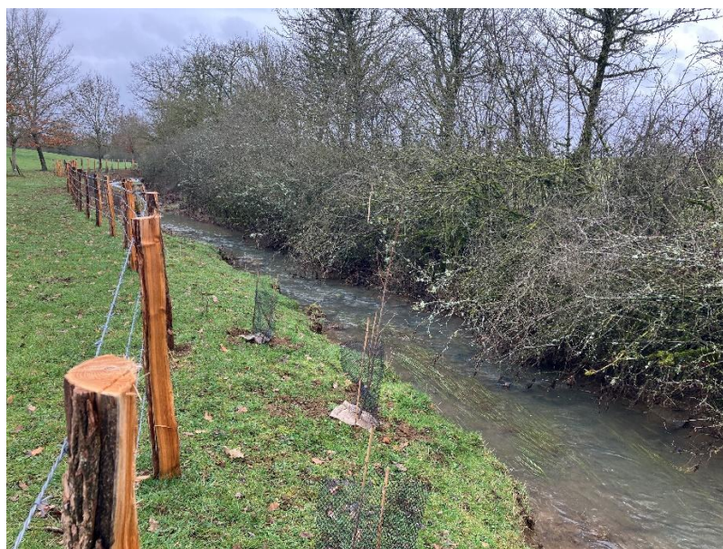
Plantations et mise en défens pour la protection contre de piétinement des bovins.