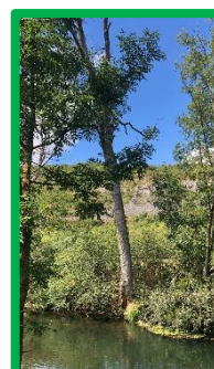
Abattage à réaliser.