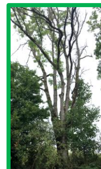
Elagage à réaliser.