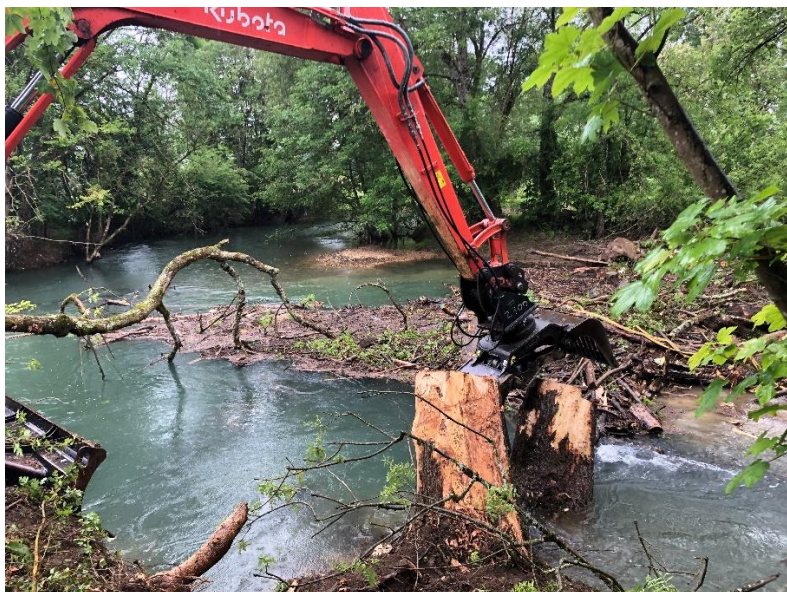
Retrait d'embâcles pour la libre circulation des écoulements.