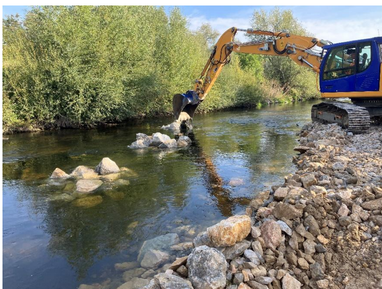
Création de banquettes minérales et caches piscicoles pour la diversification morphologique de l'Ouche en secteur rectifié de la plaine de Saône.