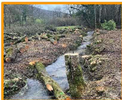
Coupe à blanc à éviter.